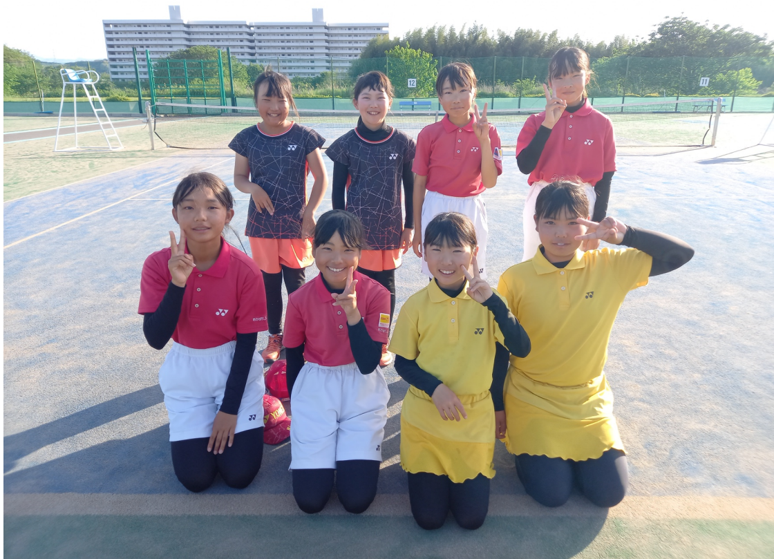
女子団体Aチーム 8名