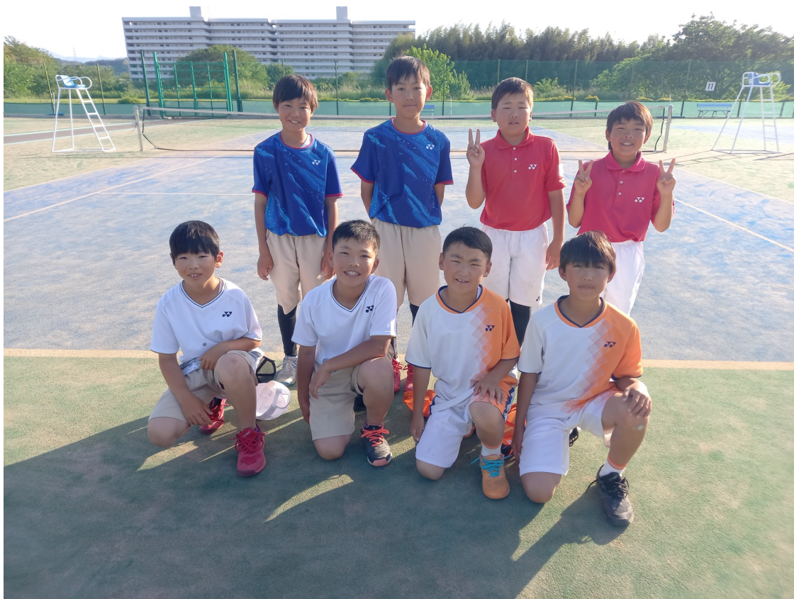
男子団体Aチーム 8名