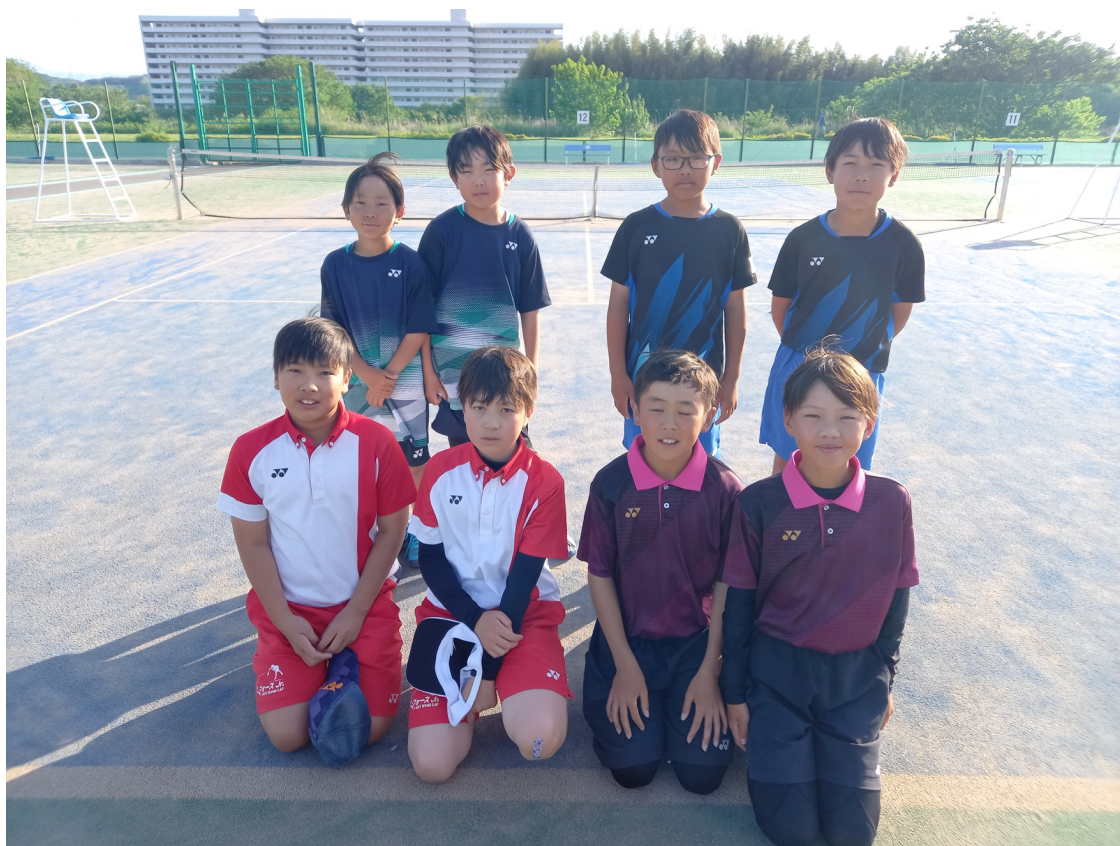
男子団体Bチーム 8名