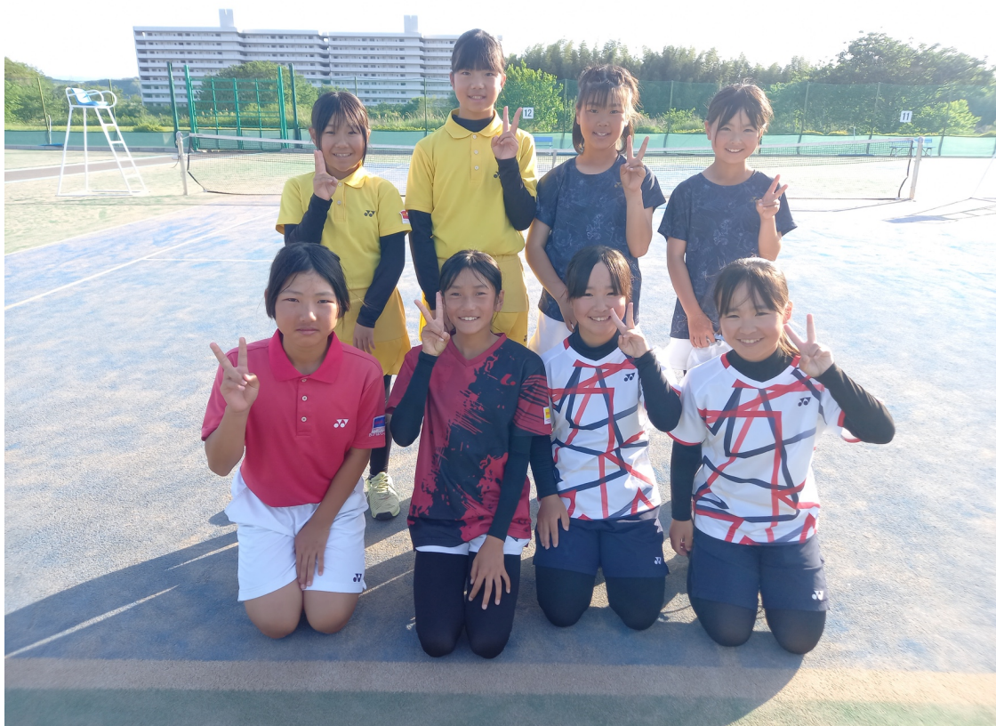
女子団体Bチーム 8名